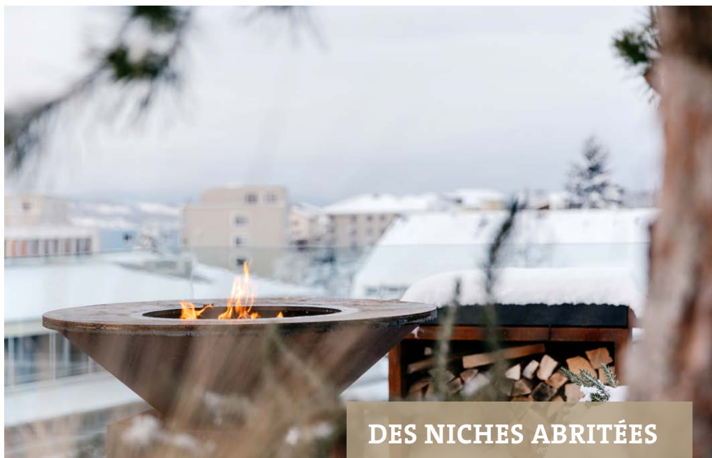
Un brasero par une froide soirée d'hiver diffuse lumière et chaleur à la fois.

Quand on aime contempler ces jeux d'ombres et de lumières, on apprécie particulièrement les lampions aux parois décorées d'ornements et motifs. Ces lampions peuvent projeter d'impressionnantes sil-